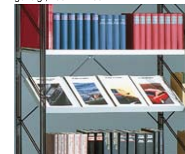
Fachböden und Prospekt-Schrägböden im Raster von 20 mm höhenverstellbar.