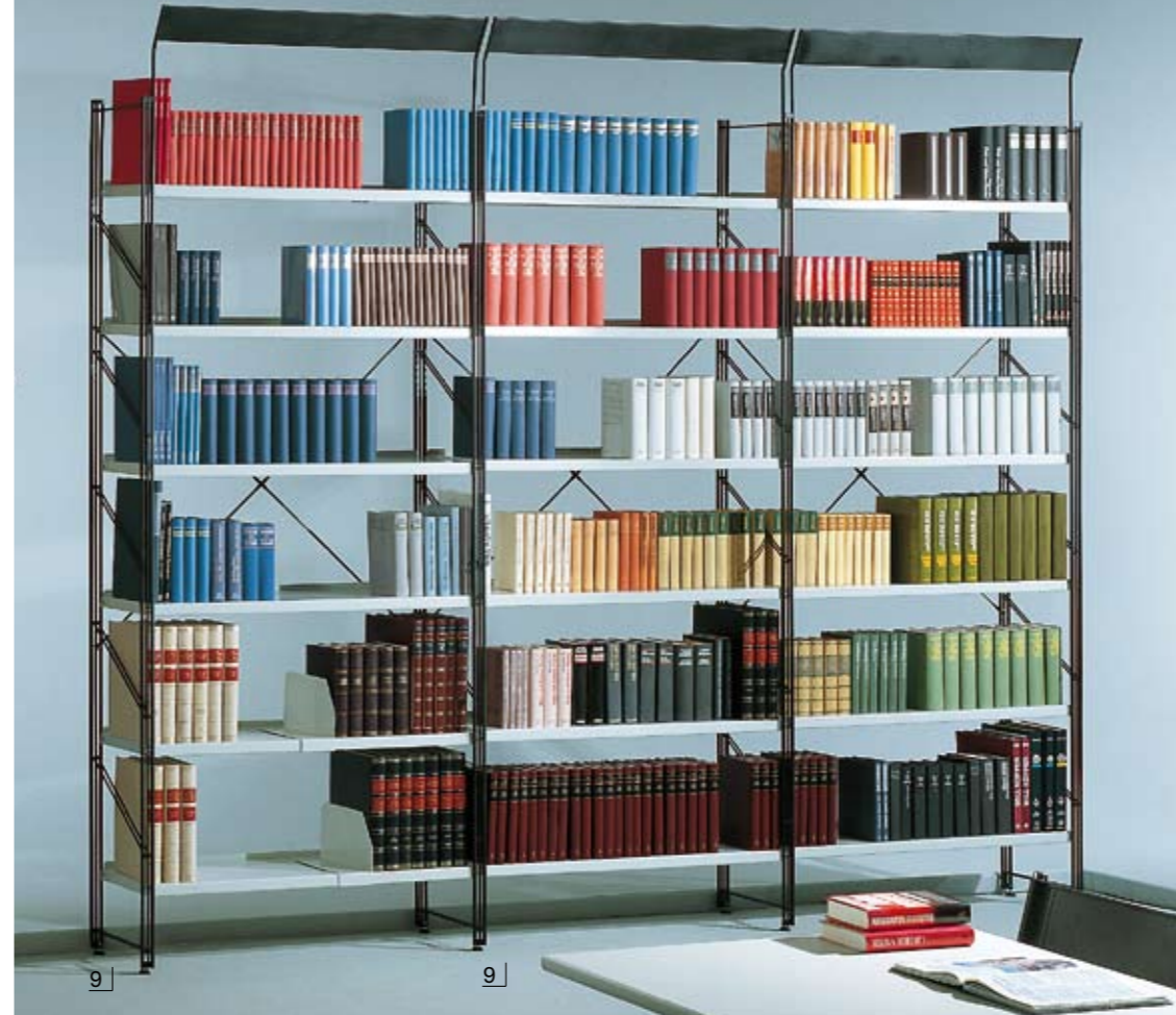
Aufsteckbare Beschriftungsblende, geneigt, 100 mm hoch.